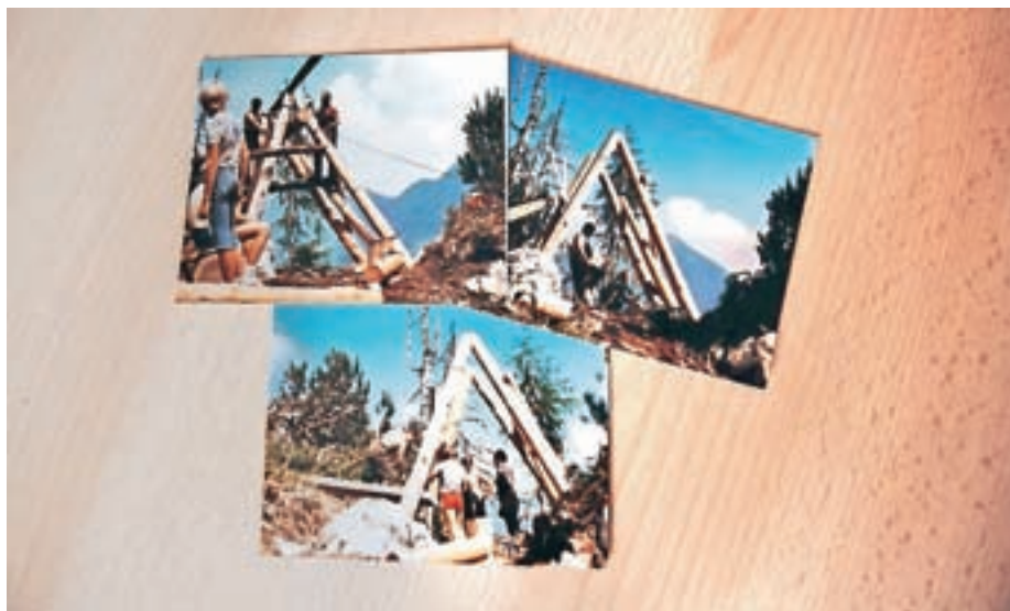
V domačem arhivu Milan Selišnik hrani fotografije gradnje tovarne žičnice.

Milan Selišnik, zdaj že 17 let upokojen, že nekaj let ni bil na Češki koči, včasih pa je veljalo, da se je šlo vsako leto vsaj enkrat gor. Tu ne šteje skrb za žičnico in redni pregledi, to je bil planinski izlet, izvemo od graditelja žičnice na Češko koč. Tovarna žičnica obratuje v času sezone, poženejo jo vsak petek, še izvemo, ko s spodnje postaje opazujemo trdne jeklenice, ki zdržijo tudi do pol tone tovora za Češko koč.