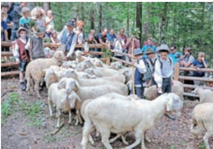
Pastirji s planin priženejo ovce, jih ostrižejo in prikažejo dela, povezana s predelavo ovčje volne.