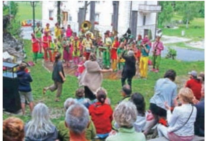
Koncert nizozemskega uličnega orkestra

Septembra je izšel ponatis knjige Jezerska kronika. Knjigo lahko naročite na TIC Jezersko: tic@jezersko.si, 051 219 282 ali v sprejemni pisarni občine. Na enak način lahko naročite tudi občinsko in slovensko zastavo.