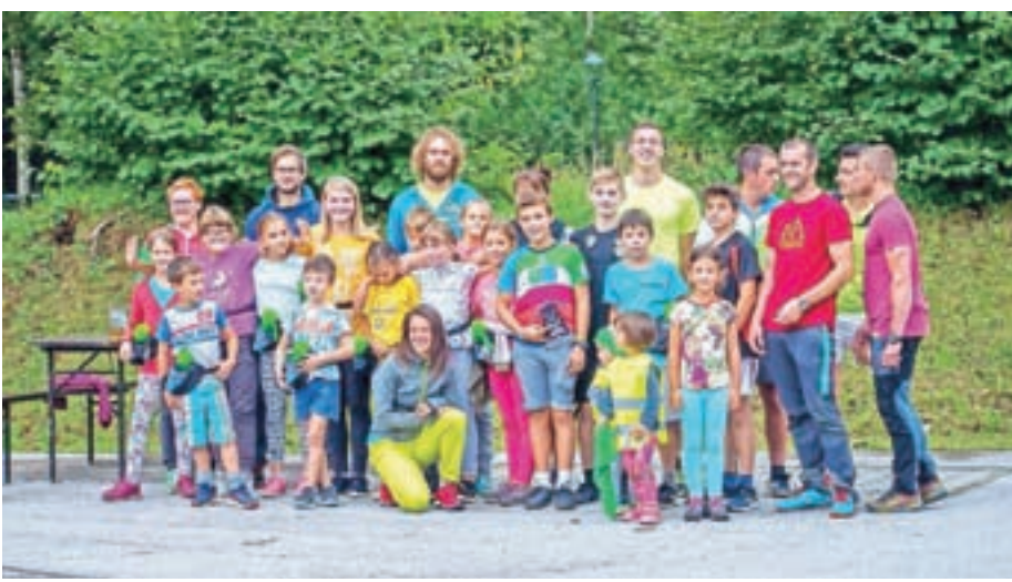
Mladi jezerski športniki