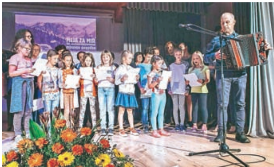
S skupno pesmijo o Jezerskem so nastopajoči sklenili slovesnost ob občinskem prazniku.

Na praznovanju v dvorani Korotan smo slišali, zakaj je mirovna pogodba tako pomembna za Jezersko. Ta pogodba je Jezersko izvzela z območja, kjer je bil pozneje izveden koroški plebiscit, in ga prisodila takrat novonastali Državi Slovencev, Hrvatov in Srbov, poznejši Jugoslaviji in današnji Sloveniji. Meja za mir, stota obletnica senžermenske mirovne pogodbe so poimenovali občinski praznik, ki ga na ta datum slavijo drugo leto zapored. "Z mirovno pogodbo je bilo doseženo, da je lahko Jezersko ostalo del matičnega naroda, ki si je pozneje