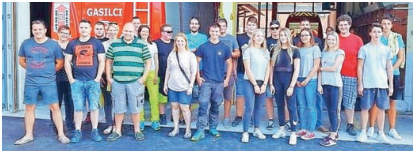
Gasilska slika v GRC Novo mesto