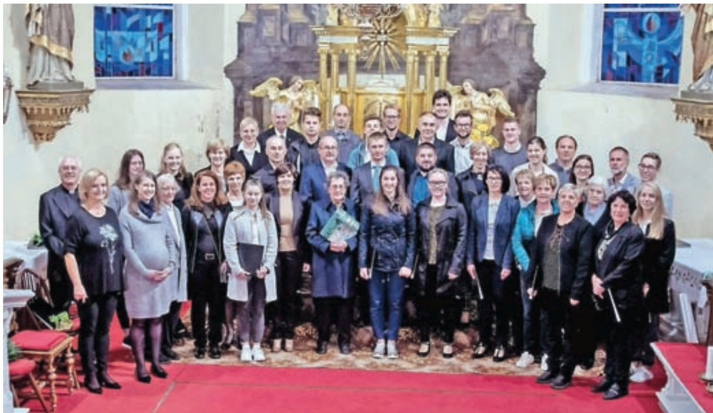
Sto petdeset let Cerkvenega pevskega zbora Jezersko

Ob 150-letnici Cerkvenega pevskega zbora Jezersko koncert in izid kronike