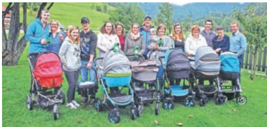
Srečanje najmlajših in njihovih staršev z županom