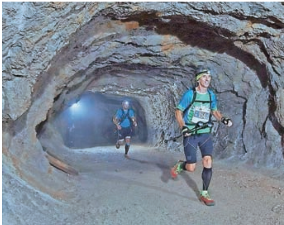
Tek po rudniških rovih

Pot nas je vodila po asfaltnih ulicah Črne do vstopa v rudniške rove, po katerih smo tekli slabih šest kilometrov in pol. V rovih je bilo prijetno hladno, ob izhodu pa nas je oblila sopara. Od tu se je trasa postavila strmo pokonci. Kača čelnih svetilk se je prebijala po ozki planinski poti proti vrhu Pece. Ko se je me-