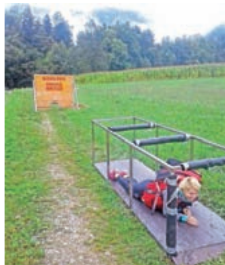
Prvi posredovalci čez ovire

Za zaključek bi se radi zahvalili organizatorju Društvu prvih posredovalcev, ki je pripravilo zanimiv strokovno-poučen