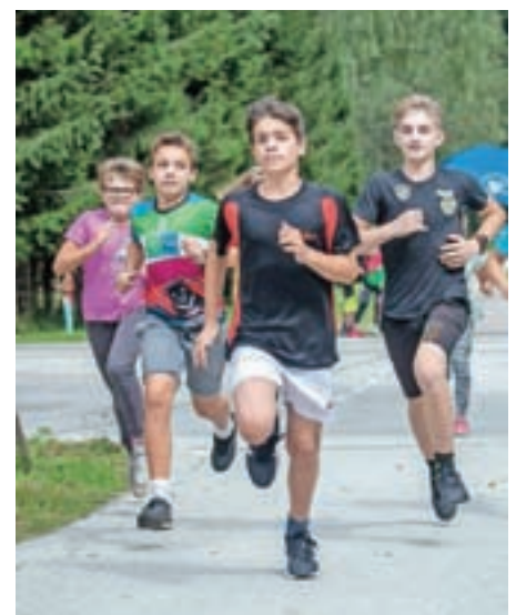
Kros, športna preizkušnja ob občinskem prazniku

začel redne treninge, ki so pripravljene za dve starostni skupini naših otrok. Izvedeno je bilo prvo testiranje, kjer smo videli, kje trenutno smo, in postavili cilje za naprej. V ponedeljek, 7. oktobra, začnemo vadbo pilatesa, posebno vrsto vaj za krepitev telesnih mišic, ki vključuje kombinacijo telesne ozaveščenosti, dihanja in tekočega, nadzorovanega gibanja, zato je namenjena tako ženski kot moški populaciji. Lepo vabljeni vsi, da se razgibate v naših programih, da ostanete fit, saj bo zimski del leta športno zanimiv z veliko snega in zimskih užitkov.